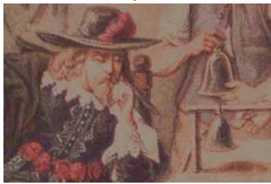
Jacob van Eyck 1590-1657