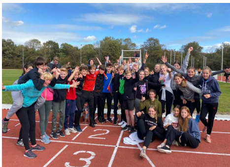
A2X tijdens atletieksportdag

“Sportverenigingen, bedrijven, scholen, de gemeente en diverse maatschappelijke partners hebben in juni 2020 het Sportakkoord Bergen gesloten. Het doel daarvan is om met elkaar meer inwoners met plezier aan het sporten en bewegen te krijgen. Een mooie impuls waarmee een aantal ambities, waaronder de ambitie Gezond en Wel ‘de Gezonde & Sportieve School’, op de rit gezet kan worden. Samen brengen we Bergen in beweging!” Daar staan wij natuurlijk helemaal achter. Daarom heeft de BSG, als één van de partners, ook een handtekening onder het akkoord gezet.