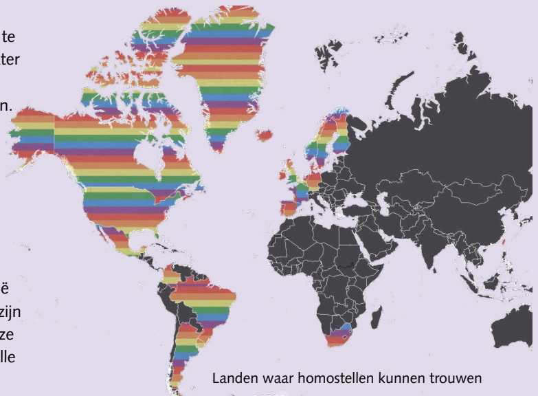
Landen waar homostellen kunnen trouwen